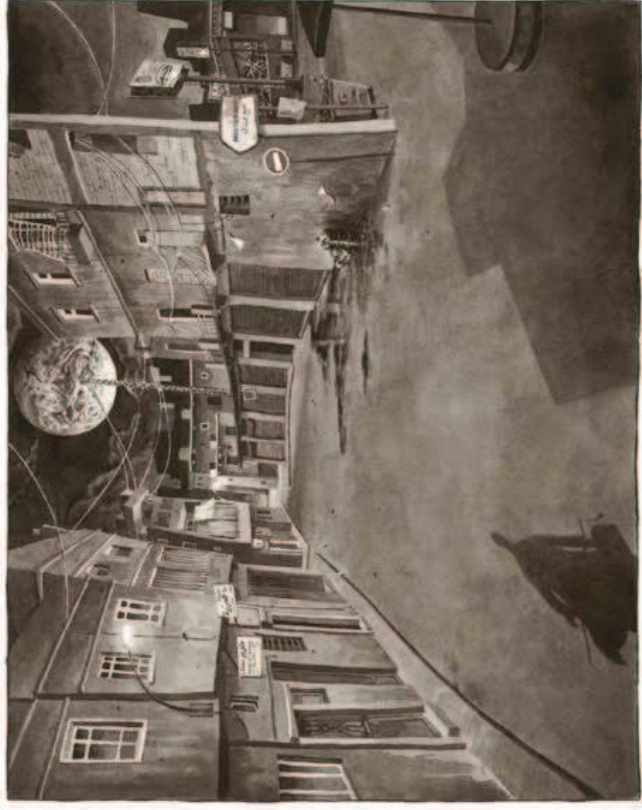
Ville avoisinant le terre de Jor'A, Mhaya